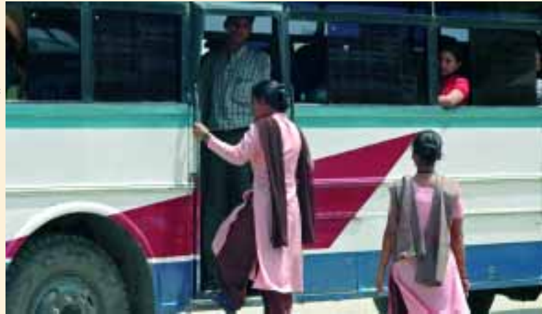
MAITI NEPAL kämpft in Nepal gegen Menschenhandel und Zwangsprostitution.