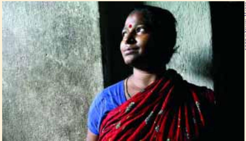
Die RESCUE FOUNDATION kämpft in Indien gegen Menschenhandel und Zwangsprostitution.

Die RESCUE FOUNDATION kämpft seit 1997 in Indien gegen Menschenhandel und Zwangsprostitution. Tausende Mädchen und Frauen werden in den Rotlichtvierteln Mumbais (Bombays) und Punas unter unvorstellbaren Bedingungen zur Prostitution gezwungen. Die RESCUE FOUNDATION hilft ihnen mit Rettungseinsätzen, bei denen sie befreit und im Anschluss medizinisch und psychologisch betreut werden.