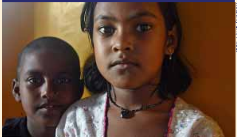
NEW LIGHT arbeitet in Indien für die Kinder von Frauen, die in der Prostitution leben.

NEW LIGHT arbeitet seit 2000 in Indien für die Kinder von Frauen, die in der Prostitution leben. Die Kinder, die in den Rotlichtvierteln Kolkatas (Kalkuttas) aufwachsen, müssen miterleben, wie ihre Mütter ihrer Arbeit nachgehen und werden ausgegrenzt und stigmatisiert. NEW LIGHT hilft ihnen unter anderem mit einer Kindertages- und -nachtstätte für über 140 Kinder.