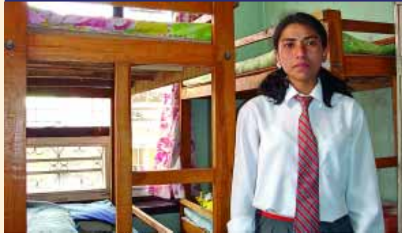
NEPAL MATRI GRIHA arbeitet in Nepal für behinderte und benachteiligte Kinder.