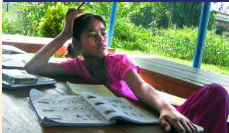
SOS BAHINI setzt sich in Nepal für benachteiligte Mädchen ein.